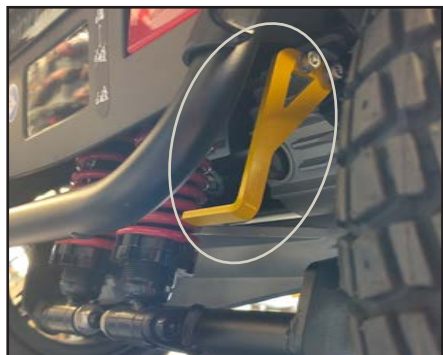
Og skyves opp for å aktivere motoren igjen (kan nå kjøre normalt).