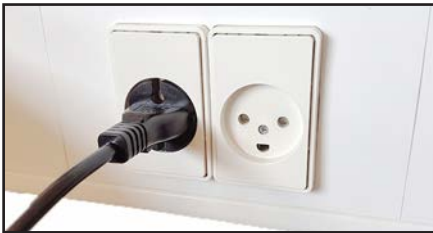
Koble støpselet til stikkkontakten.

Ytterligere informasjon i bruksanvisningen.