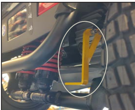
Frikoblingshåndtaket skyves ned ved frikobling (kun håndbremsen virker).