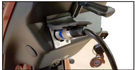
Ladestøpslet kobles til 3-polet kontakt på styrestammen. Ladekontakten er plassert under beskyttelsesplaten.