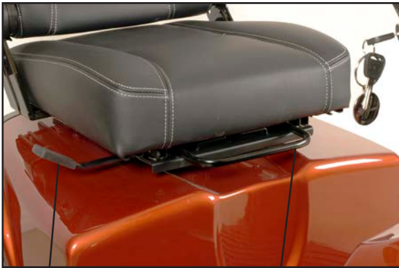
Utløserhåndtak for setedreining. Utløserhåndtak for sete frem/tilbake.

Andre seter som kan leveres til Mini Crosser, er oppbygd etter liknende prinsipper. Utløserhåndtaket er normalt montert på høyre side, men kan etter ønske monteres på venstre side.