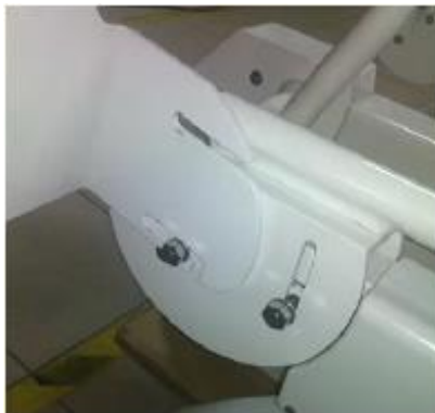
Monter seteplate som vist på tegning, og stram løselig til