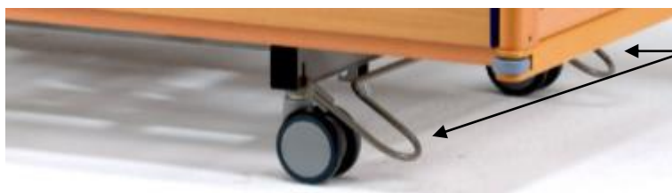
Pedal for sentralbrens

Belluno 4 er standard levert med sentralbrens, og denne skal alltid være aktivert før sengen betjenes med de elektriske motorer !