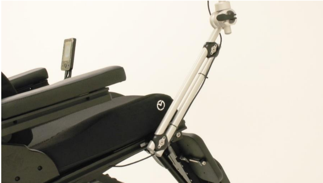
2406-1668 stativ for Tobii monteres i C-skinne på stolen.